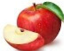
Maçã nacional gala